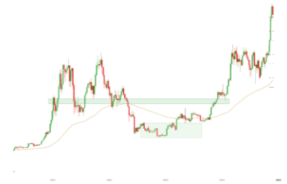
Bitcoin (Entwicklung seit 07.03.17)