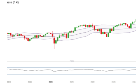
DAX (Entwicklung seit 07.03.17)

Die Sorgen um Trumps-Zölle lasten auf den DAX. Im 15 Minutenchart bildet sich eine bärische Flagge. Bei einem Ausbruch aus der Flagge könnte als nächstes das Mindestkursziel bei 19.150 Punkte.