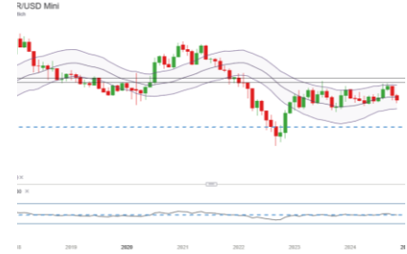
Goldpreis (Entwicklung seit 07.03.17)

6 Frühere Wertentwicklungen, Simulationen oder Prognosen sind kein verlässlicher Indikator für die künftige Wertentwicklung.