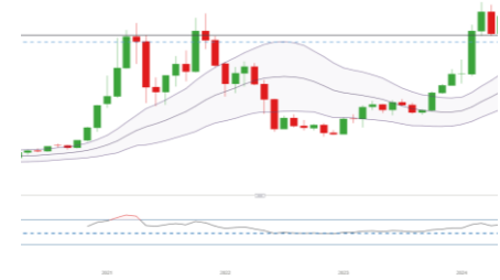
Bitcoin (Entwicklung seit 07.03.17)