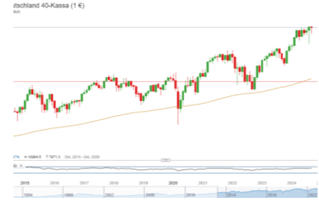
DAX (Entwicklung seit 07.03.17)

Start über dem Vortagshoch und Vortagsschluss. Während der IB wurde bereits ein Doppeltop gebildet. Das Vortagshoch (19570) fällt mit dem IB-Tief zusammen. Ein Fall unter diesen Bereich könnte einen Intraday-Abwärtstrend einleiten. Nächste Ziele wären dann der Vortagsschluss (19.531).