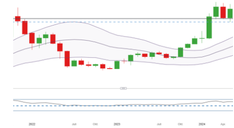
Bitcoin (Entwicklung seit 07.03.17)