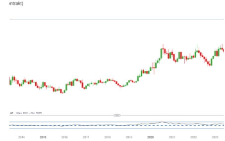
Goldpreis (Entwicklung seit 07.03.17)