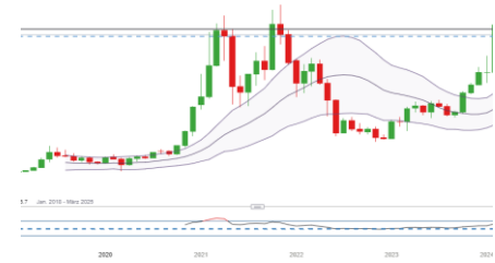
Bitcoin (Entwicklung seit 07.03.17)

* Hierbei handelt es sich um externe Analysteneinschätzungen von Researchhäusern und Banken, die ihre Einschätzungen an das Informationsportal Reuters übermitteln. Es handelt sich ausdrücklich nicht um Einschätzungen von IG Analysten.