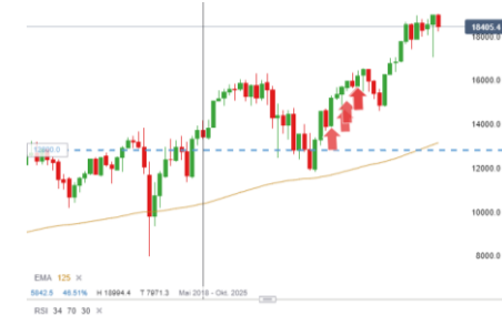
DAX (Entwicklung seit 07.03.17)

Im aktuellen Volumenprofil des deutschen Leitindex DAX befindet sich der Index nach den vergangenen sechs Monaten wieder in der High Volume Node (HVN). Diese Zone, die aktuell zwischen 18.844 und 18.180 Punkten liegt, könnte ein Indikator dafür sein, dass der DAX auch im traditionell schwachen September weiter in diesem Bereich tendiert.