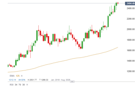
Goldpreis (Entwicklung seit 07.03.17)

Im Intraday-Handel ist für mich der Vortagsschluss eine wichtige Orientierungsgröße ob Long, Short oder Seitwärts. Neben der Verwendung von Vortagshoch/Tief, Oversightsession, Initial Balance und Bouhmidi-Bänder. Am Freitag hatten wir eine paradehaftes Beispiel. Vor den US-Arbeitsmarktdaten tendierte der Goldpreis um den Vortagsschluss herum. Bei Veröffentlichung der Arbeitsmarktdaten kam die Volatilität und der Ausbruch unter den Vortagsschluss führte zu weiteren Intraday abverkäufen.