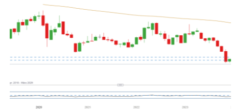
Bayer (Entwicklung seit 07.03.17)

* Hierbei handelt es sich um externe Analysteneinschätzungen von Researchhäusern und Banken, die ihre Einschätzungen an das Informationsportal Reuters übermitteln. Es handelt sich ausdrücklich nicht um Einschätzungen von IG Analysten.