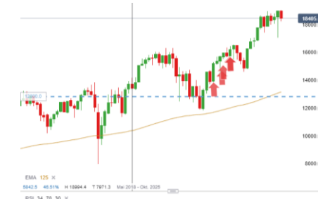
Nasdaq 100 (Entwicklung seit 07.03.17)

Der DAX startet mit leichten Gewinnen und konnte zumindest direkt über dem Vortagstief (18.274) sowie Vortagsschluss (18.301) mit einem Gap überwinden. Diese Marken sind Intraday wichtige Unterstützungen. Ein Ausbruch aus der Initial Balance (18.416) könnte die leichten Gewinne ausbauen. Als nächstes Ziel wären dann das obere Bouhmidi-Band bei 18.471 anzulaufen. Das Vortagshoch liegt heute mit großem Abstand über dem BB.