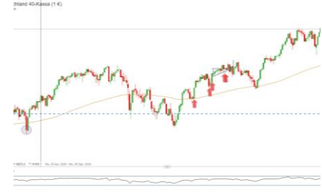
DAX (Entwicklung seit 07.03.17)

* Hierbei handelt es sich um externe Analysteneinschätzungen von Researchhäusern und Banken, die ihre Einschätzungen an das Informationsportal Reuters übermitteln. Es handelt sich ausdrücklich nicht um Einschätzungen von IG Analysten.