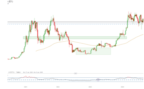
BTCUSD (Entwicklung seit 07.03.17)

75000.0 70000.0 65000.0 60000.0 57716.8 55000.0 50000.0 45000.0 40000.0 35000.0