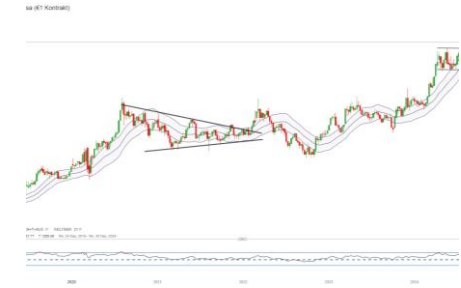
DAX (Entwicklung seit 07.03.17)