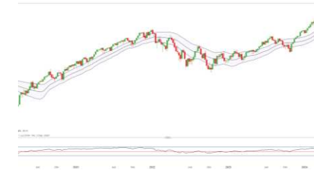
S&P 500 (Entwicklung seit 07.03.17)

* Hierbei handelt es sich um externe Analysteneinschätzungen von Researchhäusern und Banken, die ihre Einschätzungen an das Informationsportal Reuters übermitteln. Es handelt sich ausdrücklich nicht um Einschätzungen von IG Analysten.