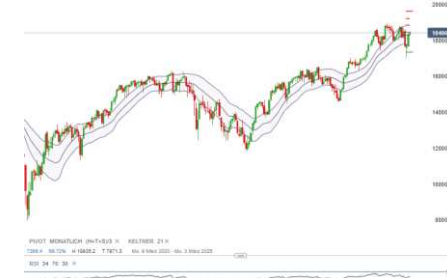
Deutsche Telekom (Entwicklung seit 07.03.17)