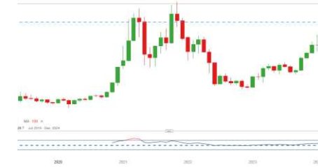
DAX (5 Jahres Chart)

Bereits binnen der Initial Balance gibt der Index das Vortagstief und das 1x untere Bouhmedi-Bands ab. Schwacher Start in den Tag - Der Abwärtsdruck hält an.