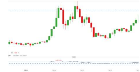
USD/JPY (5 Jahres Chart)

Aufwertungsimpulse im japanischen Yen - Heute gegen alle großen Majors am aufwerten: