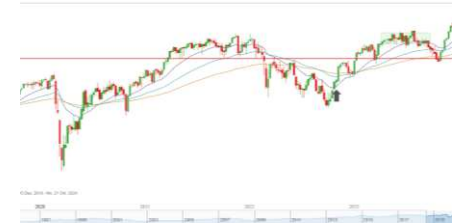
DAX (5 Jahres Chart)