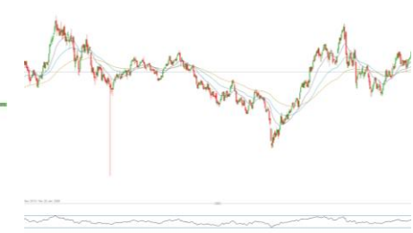
Mercedes-Benz (5 Jahres Chart)

100.0000 90.0000 80.0000 70.0000 60.0000 50.0000 40.0000 30.0000 20.0000 10.0000 0.0400 0.08% H 91.6400 T 21.0150 Mo, 3 Juli 2017 - Mo, 8 Dez. 2025 RSI 34 70 30 X 70 30