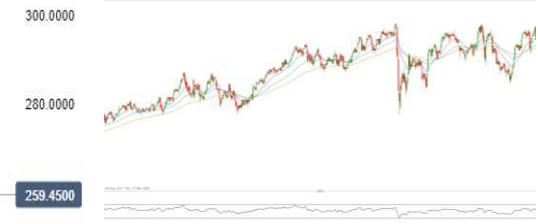
Allianz SE (5 Jahres Chart)