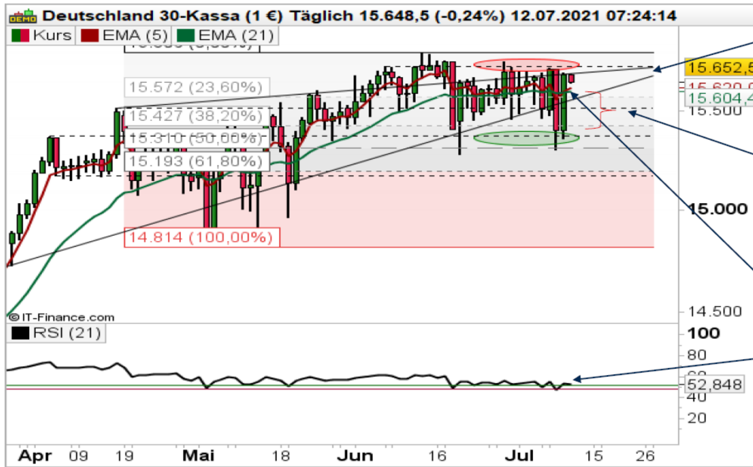
DAX auf Tagesbasis

Nun gilt es, die steigende Trendlinie bei aktuell 15.693 Punkten zu überwinden. Anschließend könnte das Rekordhoch bei 15.733 Zählern angesteuert werden