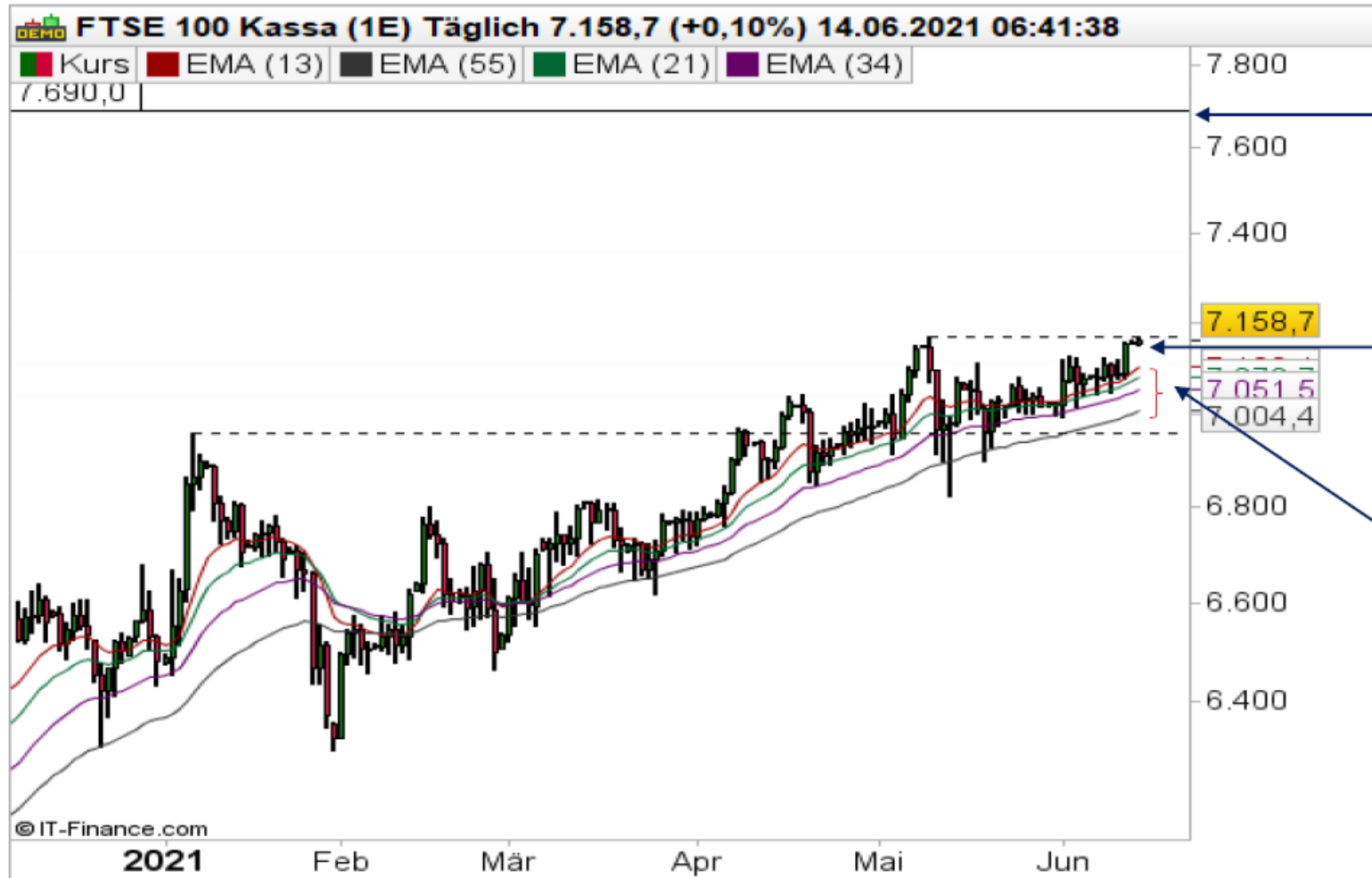
FTSE auf Tagesbasis

Darüber wartet dann das Niveau 7.690 Punkten von Januar 2020