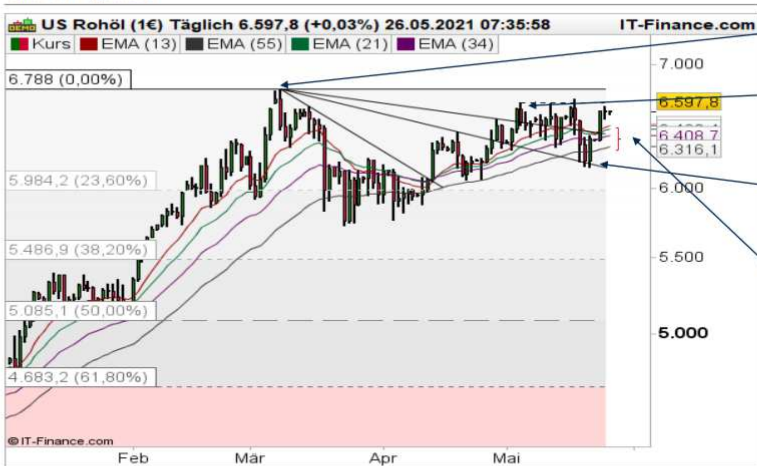
Ölpreis auf Tagesbasis

Darüber könnte das Hoch bei 67,85 USD von Anfang März dieses Jahres angepeilt werden