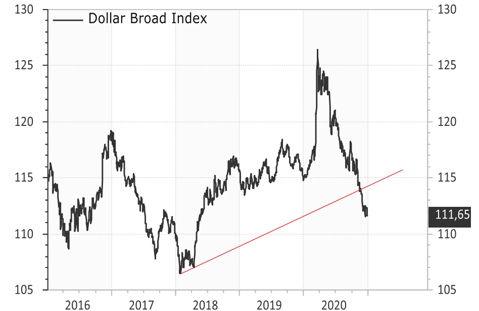
Der FED-Dollar-Broad-Index bricht langfristigen Aufwärtstrend