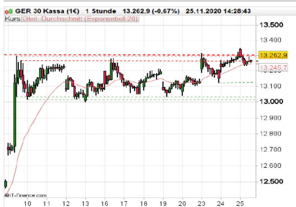
DAX auf Stundenbasis

Klassischer Fehlausbruch zur Eröffnung am 25. November